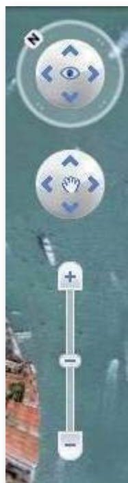
Barra con bussola, zoom e spostamento

Sulla destra, nella foto, compaiono 3 strumenti fondamentali: dall'alto, un pulsante simile a una bussola, che funge da joystick di visualizzazione . Muovendo il mouse lungo la sua circonferenza più esterna, esso permette di reimpostare la visualizzazione dell'area avendo sempre in alto il nord; usando le frecce all'interno, invece, si rende possibile un cambio di visuale, guardando lo stesso luogo da prospettive diverse, come se si stesse girando la testa. Cliccando su una freccia si osserva in quella direzione; continuando a premere il pulsante centrale del mouse si modifica la vista. Dopo aver fatto clic, per modificare la direzione del movimento, occorre spostare il mouse sul joystick.